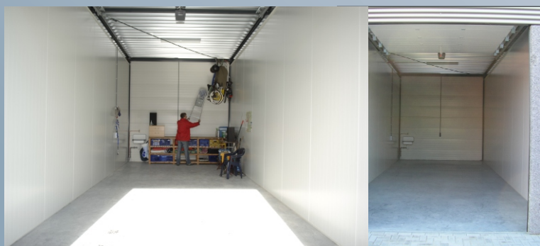
VOORBEELD BINNENZIJDJE UNIT