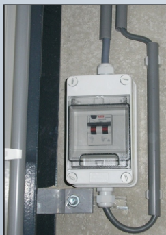
VOORBEELD ZEKERINGSKAST IN DE UNIT