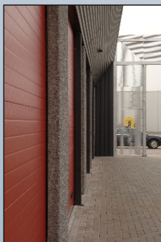
VOORBEELD AANSLAG OVERHADDEUR-BETONBLOK

O Standaard geen loopdeur, optioneel loopdeur in overhaddeur mogelijk.