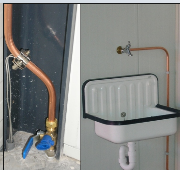
Uitstortgootsteen met kraan en aftapkraan